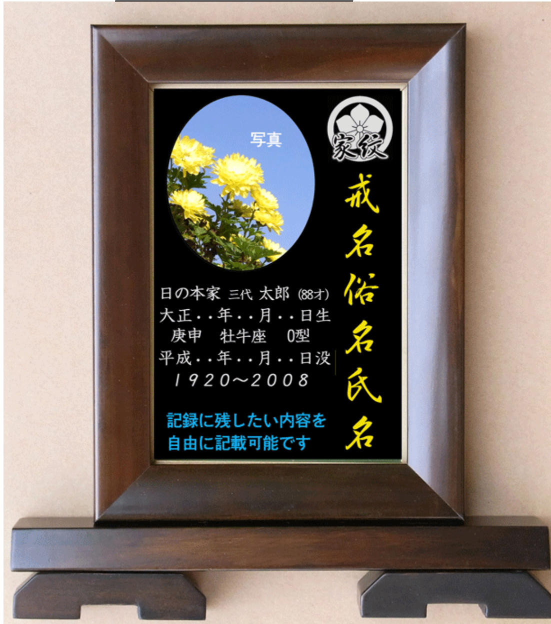
故人録【絆】家紋・戒名入り